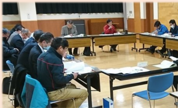
環境整備・PTA部会の様子

部会での検討課題の確認と、新しい学校への通学方法、通学路、スクールバスの運行等を議題として話し合いました。継続して協議していきます。