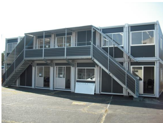
< 設置された現場事務所の外観 >