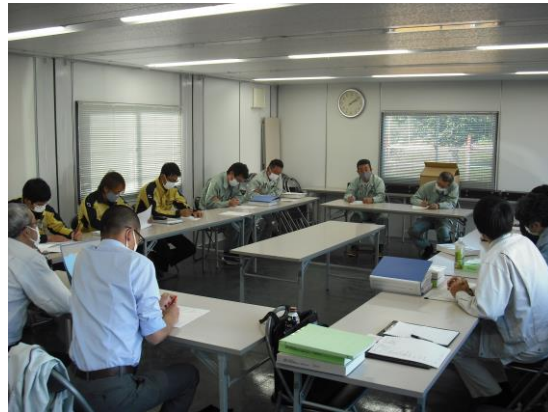
< 定例会議の様子 >

10月8日に安全祈願祭(起工式)が行われ、福岡中学校体育館裏に現場事務所が設置されました。現場事務所では、建築主体工事(中島工務店・岡山工務店)、電気・機械設備工事(ミリオン電工)を安全・円滑に進めていくために毎週定例会議を行います。