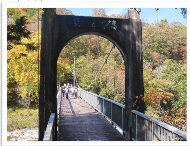
栗本橋を渡りいざゴール