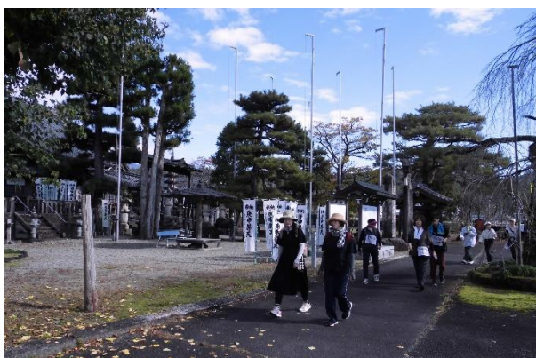
【下野庚申堂前を通り】