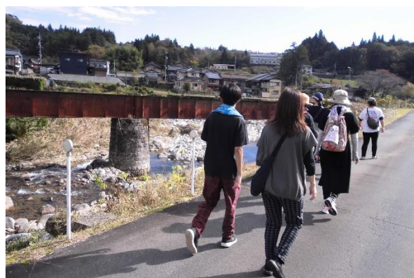
【旧北恵那鉄道橋を左に見て】