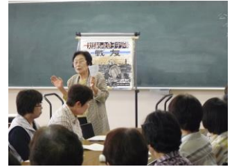
紙芝居 「大ばあちゃんの子守唄一戦友」 ～開級式にて～