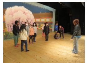
子ども歌舞伎教室の様子