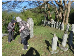
十六羅漢石仏・六地藏（田瀬）