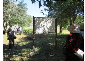
新兵衛・新四郎屋敷跡（下野）