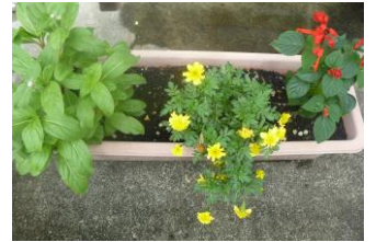
下野小学校 6年生が育てた花 (福岡公民館玄関)

「ふくおか」地区の子ども達に向けて、普段では体験できないこの地域ならではの体験をしてもらおうと、様々な行事を行ないました。行事の企画にあたっては、公民館・ふくおかまちづくり協議会だけでなく、地域の方々や各種団体の協力があったことです。「ニッ森ふれあいクラブ」「福岡子供会連絡協議会」「青少年健全育成市民会議福岡支部」「恵那魚協福岡支部」「常盤座敷敷会」の皆さん、ありがとうございました。