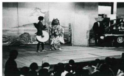
南宮座の様子(昭和8年)

明治・大正・昭和と各地に芝居小屋がありましたが、昭和30年代には、菅原座・南宮座・大盛座は使われなくなり、取り壊されました。しかし、常盤座は地域の人々によって大切に守られ現在に至ります。