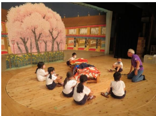
見学の様子(高山小3年生)

6月30日に高山小学校3年生が「ふるさと学習」の一環として、見学に訪れました。常盤座保存会の方から、常盤座の歴史や廻り舞台の説明を聞いたり、小道具を触らせてもらったりしていました。また、実際に奈落で廻り舞台を廻すなど、貴重な体験ができました。