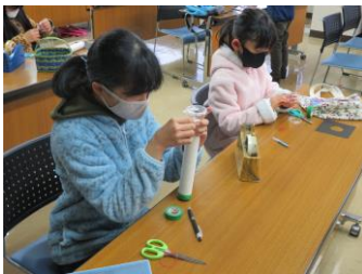
なんでも体験塾 科学工作(万華鏡作り)