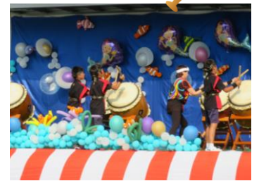
鼓道・清流子ども太鼓