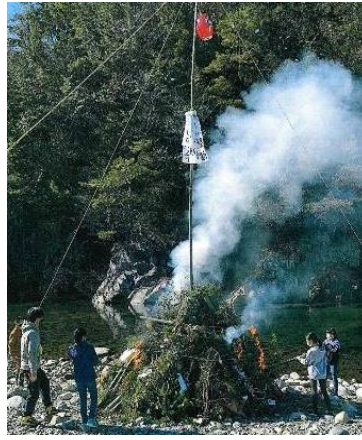
中組・宮下・栄町地区