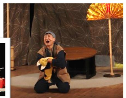
【劇団なんじゃもんじゃ】

コロナ禍で、昨年度は中止になり、今年度も一度延期しましたが、常盤座で(12月18日～19日の2日間)「常盤座演劇フェスティバル」を開催することができました。