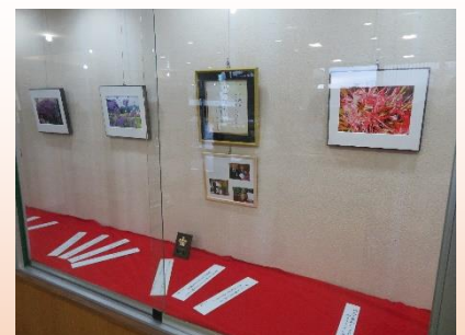
「短歌と写真のコラボ展」

水墨泉会の皆さんによる、『今年の干支～寅』をテーマにした作品が展示されます。期間は、令和4年1月10日(月)～1月24日(月)までです。ぜひご覧ください。