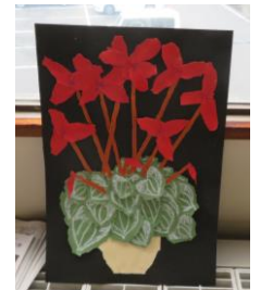
10月 ちぎり絵制作の様子