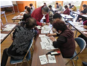
11月 己書 年賀状制作の様子

11月は、「己書」の体験をしました。筆ペンを使って、独特な文字や絵を表現します。「年賀状に使えるぞ。」「字が下手でもうまく書ける。」などの感想が聞こえてきました。あっという間の90分でした。