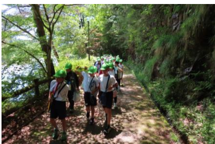
福岡ローマン溪谷遊歩道

私たちの身近にはたくさんの歴史・史跡に出会える場所があります。普段車で通過してしまう場所も、歩いて立ち寄ってみるのもいいですね。