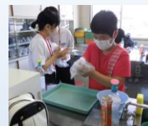
フェルトペーパーウエイト