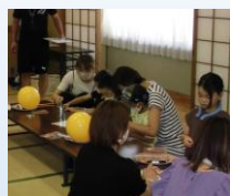
おさんぽバルーン