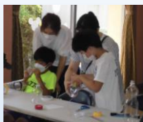
ペットボトルロケット

20年の歴史がある夏休みの伝統行事です。今年は、6人の講師の先生を招いて「ものづくり体験」をしました。子どもたちからは、「おもしろかった」「楽しかった」「もっとやりたい」という感想がありました。講師の先生方は、「自分で作った作品をうれしそうに持ち帰る姿を見て、やってよかった。」と言っていました。最後に、福岡中学校の1年生で、ボランティアに参加してくれたみなさん、ありがとうございました。