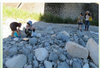
付知川岡山橋下の河原