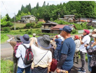
水返から見た榊山神社方面