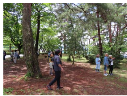
福岡中学校 曙松林公園