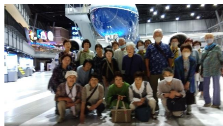
フライトオブドリームズ(常滑セントレア)