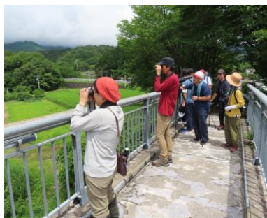
付知川 福岡ローマン橋