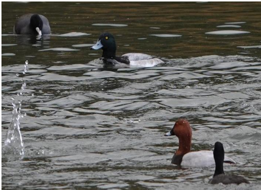
広恵寺堤に飛来しているカモたち (令和6年11月29日)