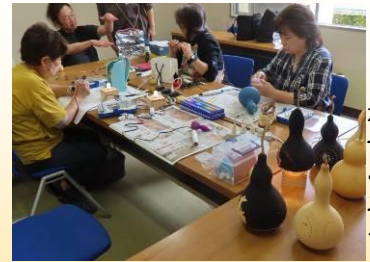
ひょうたんラングをつくる

今年度開講した講座は、他に「岐阜県の地名由来」「ふくおかの古文書と史跡」「防災を学ぼう」「太極拳入門」「自分史・エッセイを書く」「3色パステルアート」「ふれあい学級」「乳幼児学級 おひさま広場」「バードウォッチング」「素敵な文字のコツを学ぼう」の計13講座です。200名の方が受講しています。