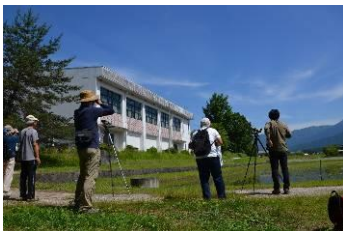
旧下野小 体育館南側 コシアカツバメとその巣