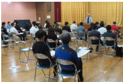
7月4日(金) 推進員・育成員・小学校地区委員 合同会議

ふくおか地域では、青少年育成員は、各町内会から1名ずつ選出され、39名で活動しています。同時に中津川市から補導員として委嘱され、下野盆踊り、榊山神社宵祭り、ふくおかふるさと花火大会の後の補導活動を行っています。その他に子ども会活動を盛り上げようと、中津川市青少年健全育成元気キッズ事業費と区からの助成金をもとに夏休みのお楽しみ会や冬の左義長などの行事を行っています。青少年推進員は、育成員の中から、区長が推薦し13名で活動しており社会を明るくする運動の啓発活動、子ども夏祭りのかき氷コーナー、親子ふるさと宝もの(史跡)さがしのスタッフなどとして、地域の青少年健全育成活動を推進しています。