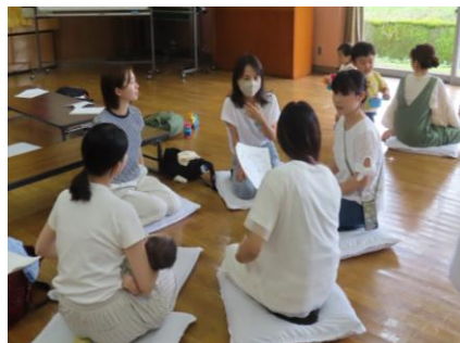
グループに分かれて、「おひさま広場」で、やってみたい事を話し合い今年度の計画を立てました