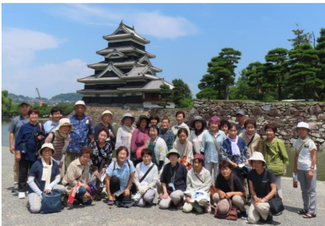
国宝松本城をバックに記念写真

7月10日(木)に国宝松本城と松本市歴史の里に行ってきました。松本城ではボランティアガイドの案内で松本城の歴史や特徴を聞き、その後、城内を見学、天守まで登った方もいました。午後は、松本市歴史の里(野外博物館)で明治～昭和の歴史的建造物を見学し松本の歴史を学びました。