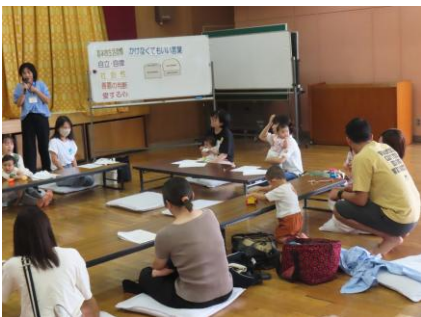
中津川市生涯学習スポーツ課の家庭教育指導員から、子育てについて大切なことを学びました

6月24日(火) 14組 31名の親子が参加して「おひさま広場」がスタートしました。