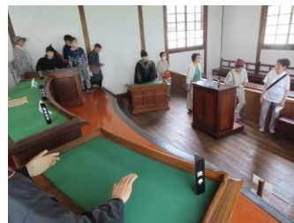
旧松本区裁判所庁舎 (国の重要文化財)