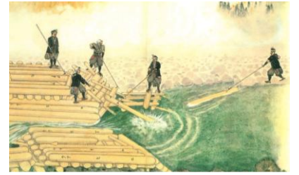
(付知川における材木伐出の沿革と絵解り)

20年に一度の伊勢神宮式年遷宮に向けての裏木曾御用材の伐採や送迎が話題になりましたが、昔は、付知川で木材を運んでいました。福岡公民館講座「ふくおかの歴史」講座では、付知川で木材を運んでいたという「付知川の川狩り」を学習しました。展示期間は、令和7年8月18日(月)まで。公民館にお越しの際は、ご覧下さい。