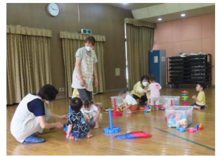
お母さん達が話し合っている時は、主任児童委員・民生児童委員のボランティアの方々がお子さんを見守ってくれました