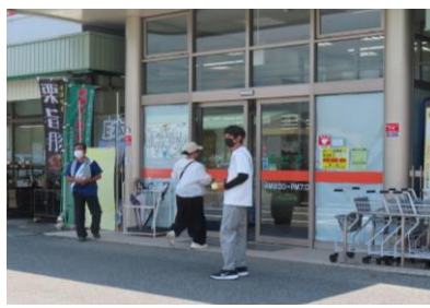
7月6日(日) 社会を明るくする運動の啓発活動 青少年推進員、民生児童委員、主任児童委員、保護司会の方が参加